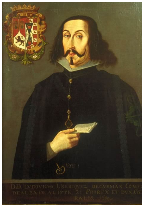
Luis Enríquez de Guzmán

Inicialmente al alcanzar el río Concho, sería nombrado como río de las Perlas o río Concho, "río de las conchas", tras encontrar allí los citados mejillones nacarados de Tampico.