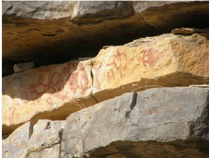
El nombre de Paint Rock proviene de los antiguos y numerosos pictogramas que encontramos a los largo de las paredes de roca del río Concho

incluso una imagen del demonio tal como fue interpretada a la vista de las enseñanzas de los misioneros.