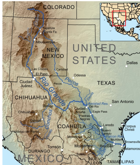
El río Conchos

Centrándonos en el río motivo de estas líneas, ubicado respecto de la antigua provincia de Nuevo México y de su capital Santa Fé al sureste de la misma, consta de tres cauces del mismo nombre, los ríos Concho del Norte, Concho del Sur, y Concho Central, siendo el primero el más largo.