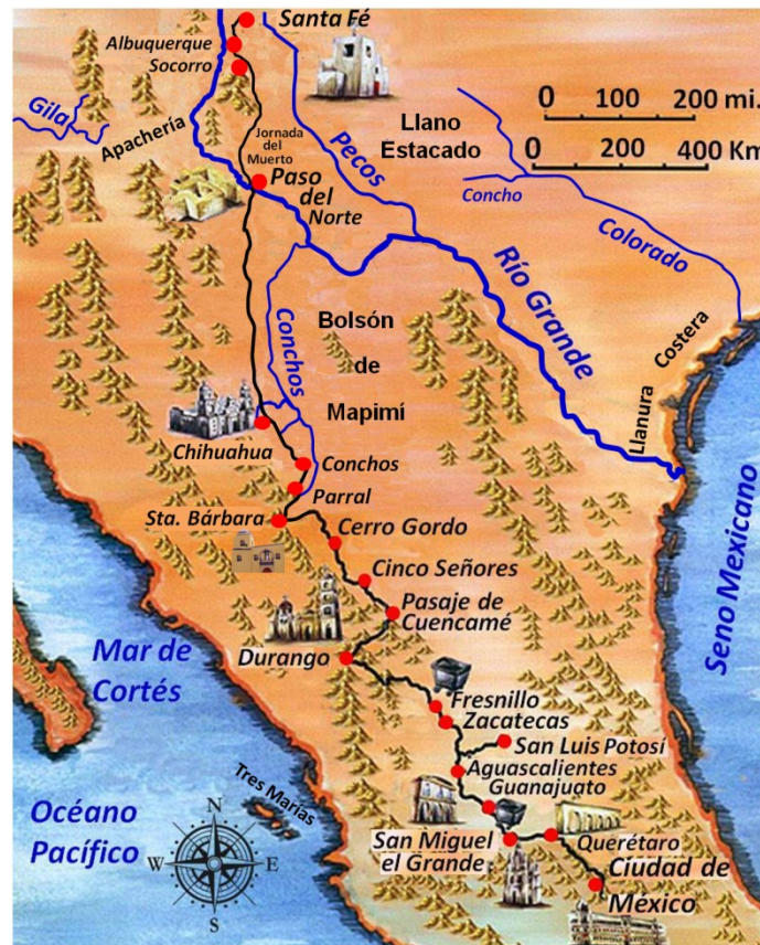
Elaboración propia ©José Antonio Crespo-Francés

Para empezar primeramente trataremos de ubicar geográficamente el lugar y evitar posibles equívocos. Quizá sea más conocido el río Conchos por ser el que cruzó la expedición de Juan de Oñate tras partir de Santa Bárbara en 1598 para fundar nuevo México una vez cruzara el río Grande o Bravo del Norte tras su épico itinerario a través del Camino Real de Tierra Adentro.